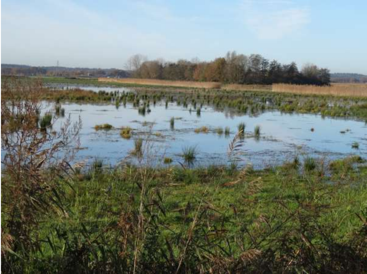
Zicht op het bosje met de voormalige eendenkooi