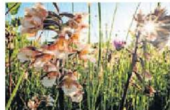
▲ De moeraswespenorchis.

Via deze link kunt U zich aanmelden als lid: Lidmaatschap - Stichting Mooi Binnenveld Ledenadministratie en Nieuwsbrief redactie: Willem Heemskerk, info@mooibinnenveld.nl