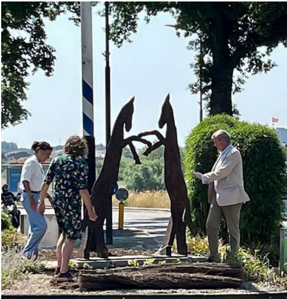
De opening van het beeld op Cuneradag 2023

De vrolijke steigerende paarden op de rotonde van het Paardenveld begroeten binnenkomen d verkeer en dagen historici uit. Het beeld op de rotonde bij het Paardenveld is gemaakt van cortenstaal. Een legering van ijzer, koper, fosfor, nikkel, chroom en silicium. Door roest krijgt het de typische roodbruine kleur. Het roesten gaat niet verder dan een dunne laag en daarom is het duurzaam materiaal.