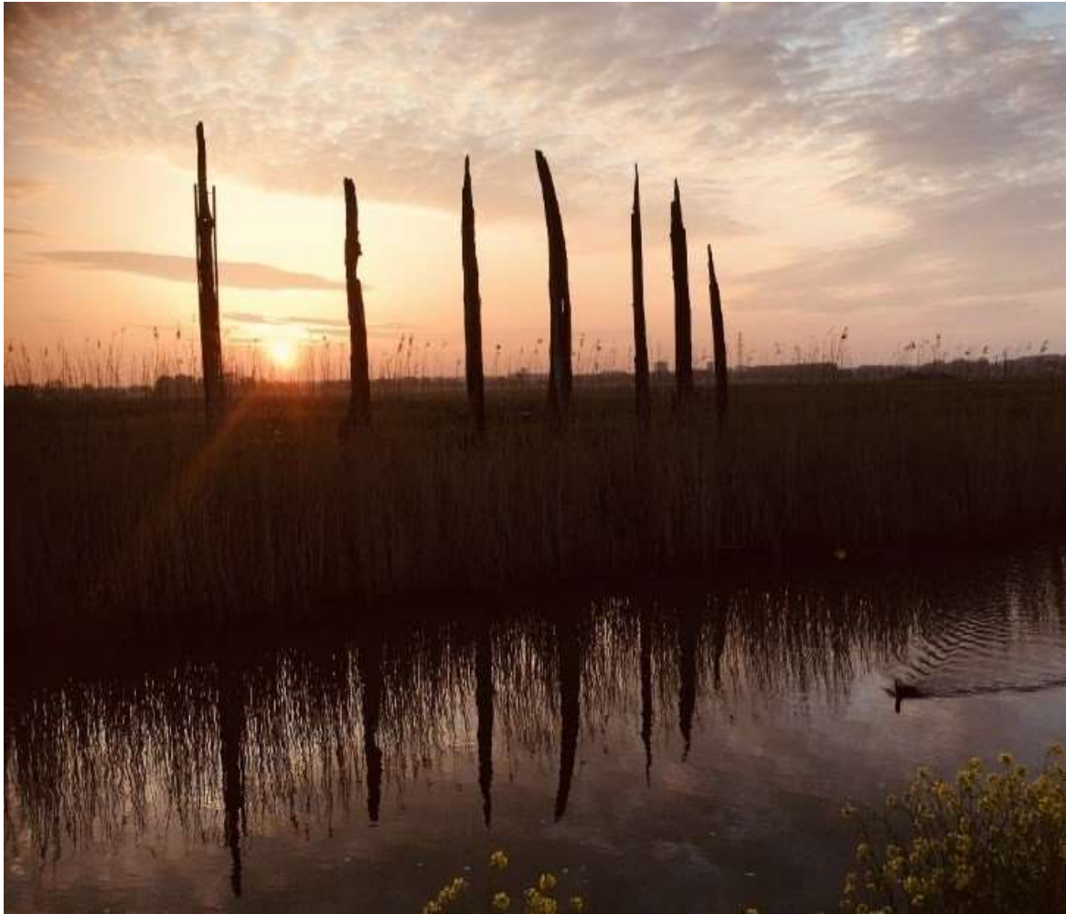
Kienhouten boomstammen van 5000 tot 7000 jaren oud in het Binnenveld.

In de voorlaatste ijstijd kwam het landijs in ons gebied tot de lijn Wageningen-Rhenen. Het gewicht van het ijs, van ongeveer 100 meter dikte, drukte de bodem naar beneden. Door het smeltend ijs werden zand en stenen zijwaarts geduwd. Zo werden de Veluwe en de Utrechtse heuvelrug gevormd. Na de laatste ijstijd, zo'n 11.000 jaar geleden werd de vallei een moeras en ontstond een laag veen tot wel 9 meter hoogte. Vanaf de Middeleeuwen werd het afgraven van veen en verhandelen van turf een belangrijke bron van werk en inkomsten. Het afgegraven land werd in gebruik genomen voor de landbouw.