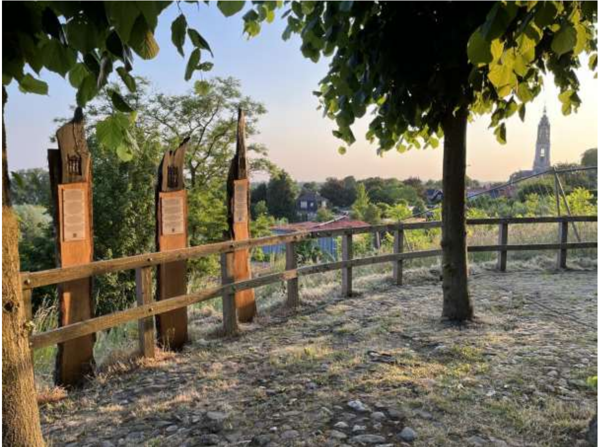
De drie statiemonumenten voor Elst, Prattenburg en Achterberg staan tijdelijk opgesteld op de Cuneraheuvvel.

Statie Achterberg: De statie in Achterberg was een uit steen opgetrokken bouwwerk dat in 1580 in driedagen tijd werd afgebroken. Bij afbraak werden de stenen afgebikt om hergebruikt te kunnen worden. Het dorp Achterberg was een belangrijke plaats in de Middeleeuwen als meest vooruitgeschoven punt van Utrecht. Het gebied van het Binnenveld vormde een natuurlijke buffer tussen de onderling vijandige troepen. In de 12e eeuw bouwde de bisschop van Utrecht Kasteel ter Horst in Achterberg. De Gelderse krijgsheren bouwden Kasteel de Tarthorst in Wageningen. Beide kastelen zijn inmiddels afgebroken.