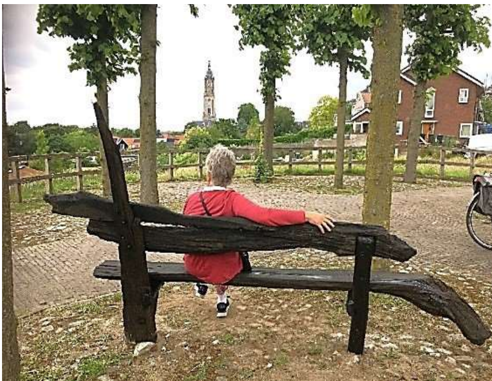
Bankje van kienhout

Op de heuvel staat een bankje met een loden pelgrimsteken in de rugleuning. Het bankje is uitgevoerd in kienhout van duizenden jaren oud, afkomstig uit het Binnenveld. De Cunerakerk werd indertijd zo gebouwd dat de centrale as van het gebouw precies gericht staat op de Cuneraheuvel. Dat is goed te beleven door op het bankje te gaan zitten. Ook de kerk in Wijk bij Duurstede staat op deze lijn. Hopelijk blijft deze zichtlijn intact als in de buurt nieuwbouw plaats vindt. Er zijn ook twaalf lindenbomen geplant, die refereren aan de twaalf apostelen.