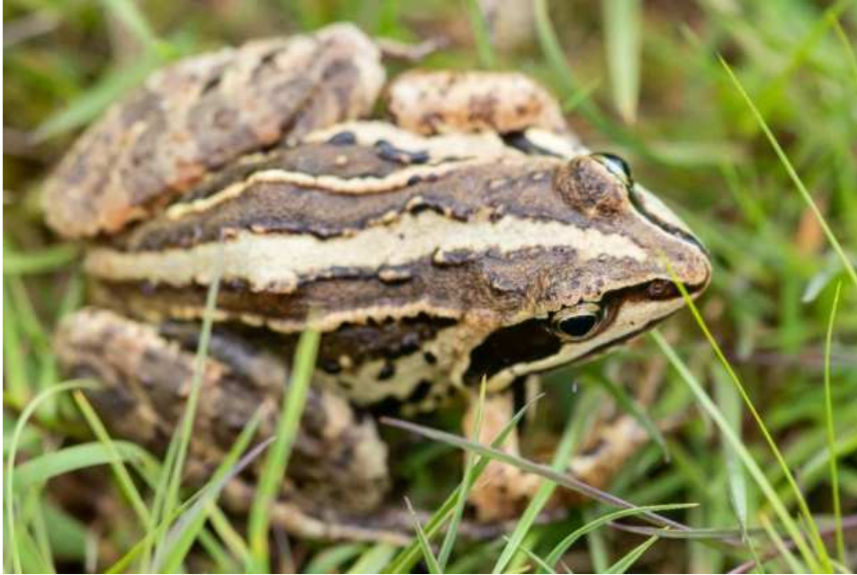
Figuur 10: Een mooi contrastrijk getekende adulte heikikker in de Bennekomse Meent op 11 juni 2024.

Op 16 september bezocht ik nog een keer het gebied en vond ik met veel moeite 7 heikikkers (4 juveniel, 3 subadult). Verder zag ik met name meer dan 100 juveniele groene kikkers die toen net het water verlaten hadden en daarnaast enkele bruine kikkers, gewone padden en twee poelkikkers.