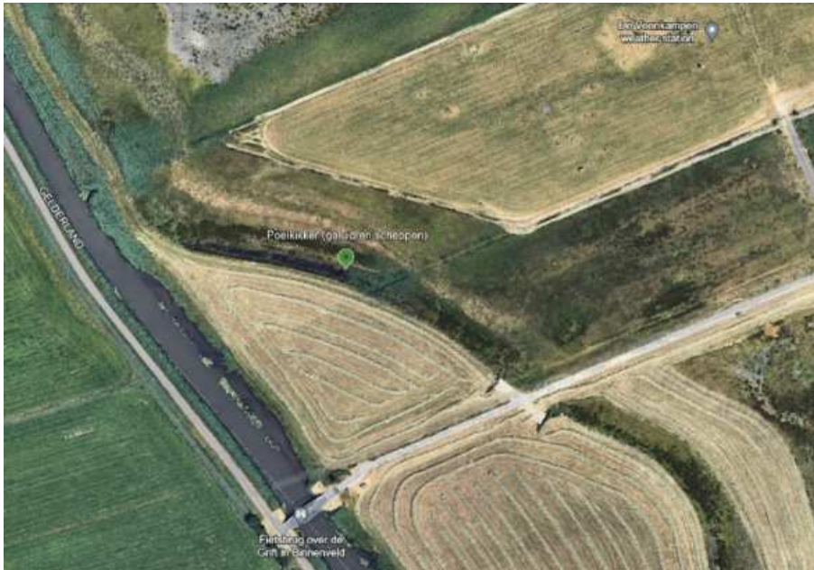
Figuur 8: Detailkaart locatie 7 - Kromme Eem.

Op deze locatie kan ook gezocht worden naar salamanders door in het donker met een zaklamp langs het water te lopen. Waarnemingen van vissen die ik tijdens het scheppen doe worden meegenomen in het Meetnet Zoetwatervissen.