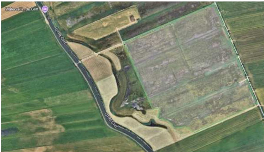
Figuur 5: Detailkaart locatie 6 - Zuidelijke Binnenveldse Hooilanden.

Locatie 8 is in 2024 nieuw toegevoegd aan de lijst. Dit meest zuidelijke gebied van de Binnenveldse Hooilanden bleek in 2023 een belangrijk leefgebied te zijn voor de poelkikker en daarom is hier in 2024 ook met geluid gemonitord.