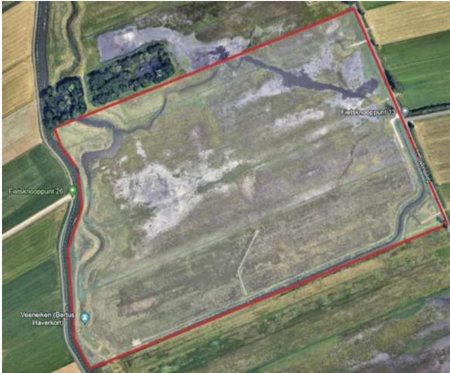
Figuur 4: Detailkaart locatie 6 – Knooppunt 13.

Locatie 8 is in 2024 nieuw toegevoegd aan de lijst. Dit meest zuidelijke gebied van de Binnenveldse Hooilanden bleek in 2023 een belangrijk leefgebied te zijn voor de poelkikker en daarom is hier in 2024 ook met geluid gemonitord.