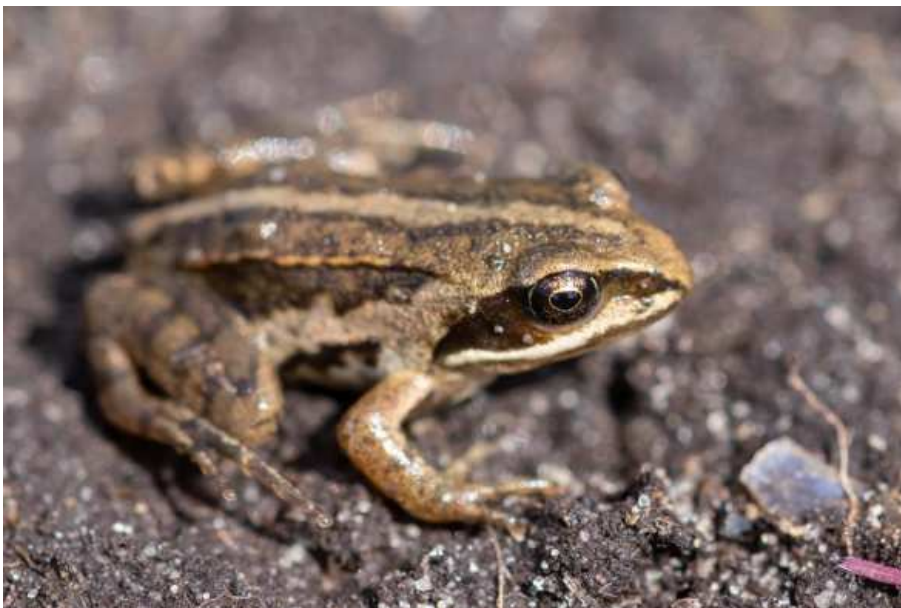
Figuur 9: Een juveniele heikikker met de kenmerkende (maar niet noodzakelijke!) lichte rugstreep in de Bennekomse Meent op 11 juni 2024.