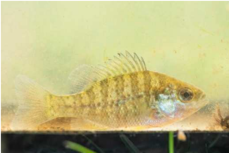
Figuur 12: Gevangen zonnebaars in de Binnenveldse Hooilanden op 1 juni 2024.

Op 8 april in de avond was het op deze locatie doodstil. Enkel een slootje oostelijker, langs het meteoveld waren enkele poelkickers te horen.