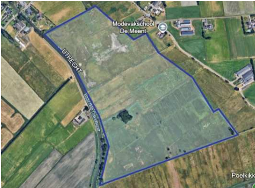
Figuur 6: Detailkaart locatie 2 – Bennekomse Meent.

Zie voor uitleg van locatie 2 hierboven. Ten opzichte van 2023 is het zoekgebied flink uitgebreid. Dit naar aanleiding van waarnemingen van Henk Kloen gedurende het seizoen in 2024 waaruit bleek dat het verspreidingsgebied van de heikikker verder was uitgebreid dan ik had verwacht. Ik heb de gehele Bennekomse Meent (vanaf bestaande, maar niet openbaar toegankelijke paden) bezocht.