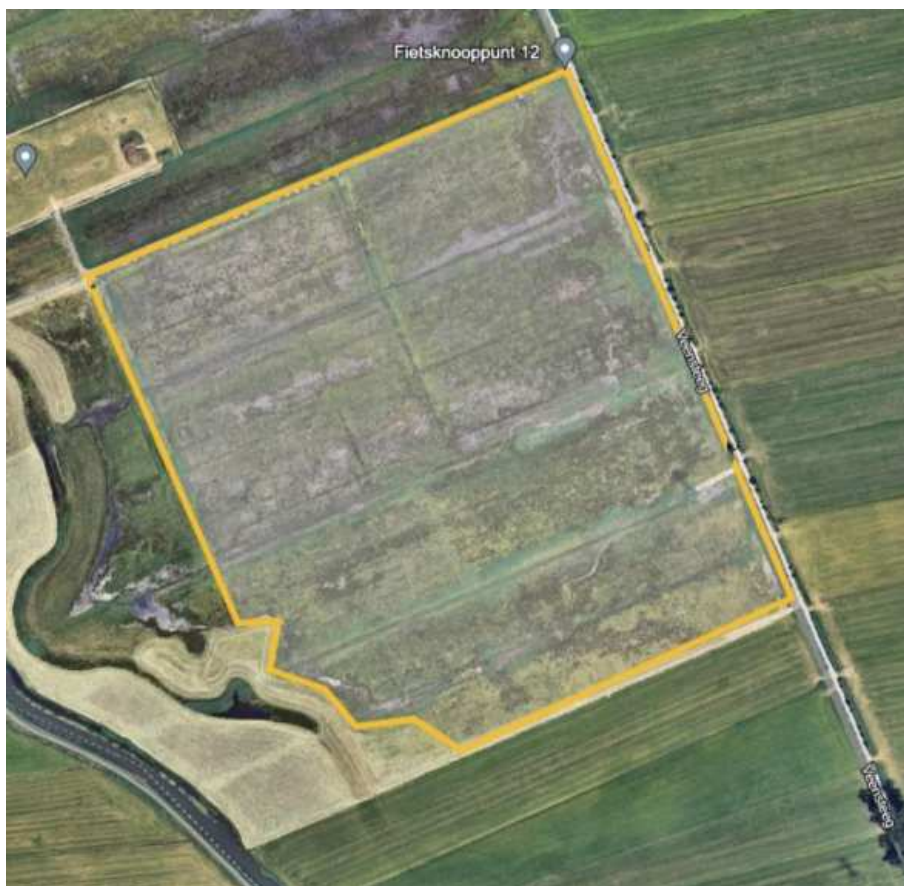
Figuur 13: Detailkaart Locatie 8. Dit gebied is in 2023 geïnventariseerd onderweg naar andere gebieden en in 2024 voor het eerst opgenomen in de monitoring.

In 2024 is deze locatie als locatie 8 voor het eerst in het plan komen. Het gaat om een vierkant tussen de Grift, het Koekoeksbloempad en de Veensteeg.