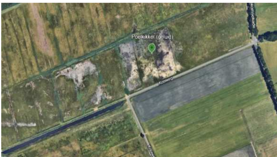
Figuur 7: Detailkaart locatie 3 – Bennekomse Hooilanden.

Locatie 3 is geschikt leefgebied voor de poelkikker en kan vanaf de Kooiweg op basis van geluid geïntervieweerd worden.