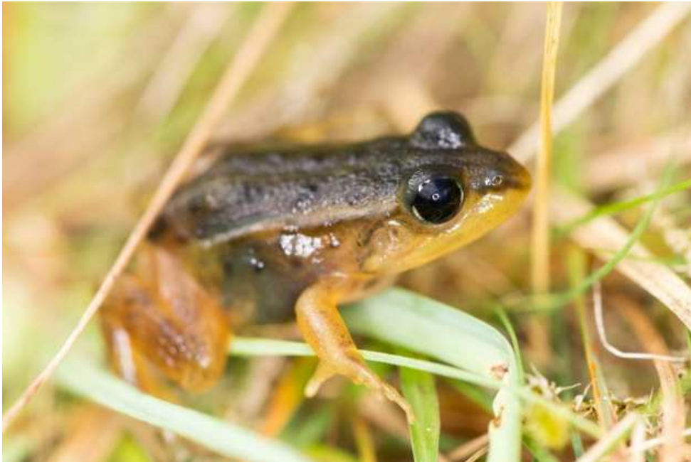
Figuur 11: Een sterk afwijkende juveniele groene kikker in de Bennekomse Meent. Volgens Maarten Gilbert (RAVON) heeft dit exemplaar mogelijk ontbrekende iridoforen en verminderde pigmentaanmaak in de xanthoforen. Dit veroorzaakt de vreemde combinatie van extreem gele en extreem donkere kleuren.

Op 16 september bezocht ik nog een keer het gebied en vond ik met veel moeite 7 heikikkers (4 juveniel, 3 subadult). Verder zag ik met name meer dan 100 juveniele groene kikkers die toen net het water verlaten hadden en daarnaast enkele bruine kikkers, gewone padden en twee poelkikkers.